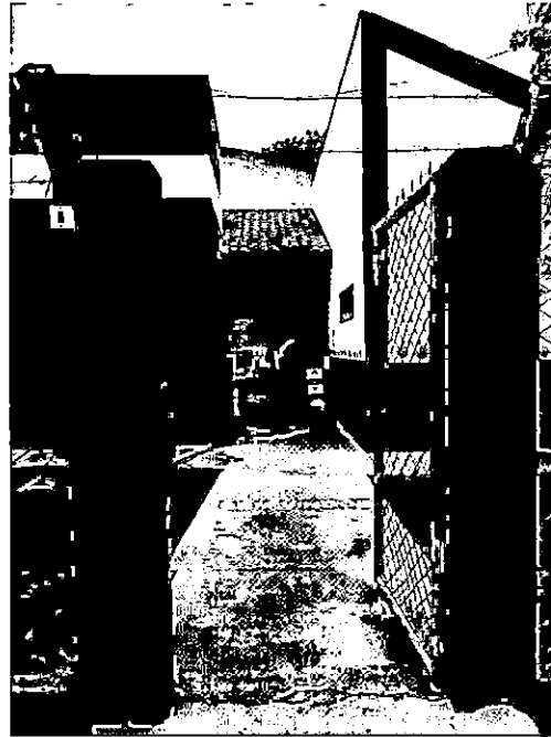
CONSTRUÇÃO DE COBERTURA NA ENTRADA DO PORTÃO ATÉ A VARANDA