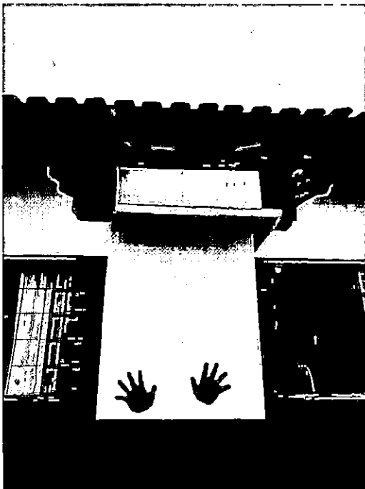
MANUTENÇÃO NO TELHADO E INFILTRAÇÕES